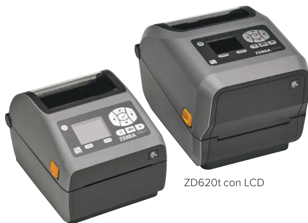
ZD620d con LCD

Cuando la calidad de la impresión, la productividad, la flexibilidad en las aplicaciones y la facilidad de administración son importantes, la ZD620 es la opción. La ZD620 es parte de la nueva generación de impresoras de mesa de Zebra, sustituye las impresoras de la Serie GX y a la ZD500 de Zebra y supera a las impresoras de mesa comunes con una calidad de impresión premium y funciones de punta. La impresora es disponible en los modelos de transferencia térmica directa y térmica, así como modelos específicos para el sector del cuidado de la salud. La ZD620 fue creada para atender a una gran variedad de aplicaciones y proporciona más funciones estándar que cualquier impresora de mesa de Zebra. Con una interfaz opcional de 10 botones con pantalla LCD en color, usted no necesita adivinar la configuración y el estado de la impresora. La ZD620 usa Link-OS® y nuestro poderoso conjunto de aplicaciones, utilitarios y herramientas de desarrollador Print DNA, que ofrece una experiencia de impresión superior con un mejor desempeño, una administración remota simplificada y fácil integración. La ZD620 de Zebra: ofrece la velocidad de impresión, la calidad de impresión y la administración que usted necesita para continuar sus operaciones.